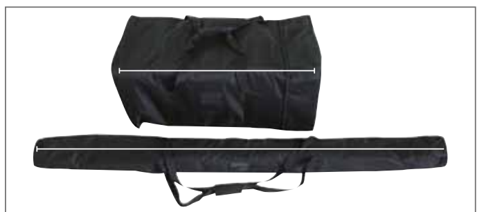
Tragetaschen als zweckmäßige Transportverpackung