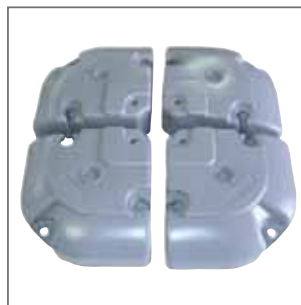
Wassertank kann zum Transport in vier handliche Teile zerlegt werden