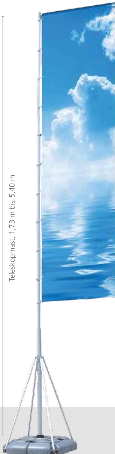
Teleskopmast, 1,73 m bis 5,40 m

Das formschöne Produkt besteht aus einem vierteiligen Wassertank aus Kunststoff als Ballastfuß und der Teleskopstange aus Aluminium. Die Teleskopstange kann auf max. 5,40 m ausgefahren werden und besitzt einen Drehausleger mit 1 m Länge. Die max. aufziehbare Fahnengröße beträgt 1,1 x 4 m. Die Konstruktion kann ohne Werkzeuge aufgebaut und wieder zerlegt werden. Als Transportverpackung gehören zwei Stofftragetaschen zum Lieferumfang. Die Auslieferung des mobilen Teleskopmast Event 540 erfolgt demontiert, wobei die Tragetaschen in zwei Einzelkartons geliefert werden.