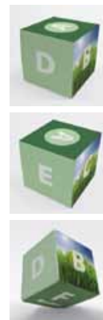
verschiedene Ansichten des fertigen Würfels

Haben Sie mehrere Würfel mit verschiedenen Motiven so ist für jeden Würfel eine Standskizze erforderlich.